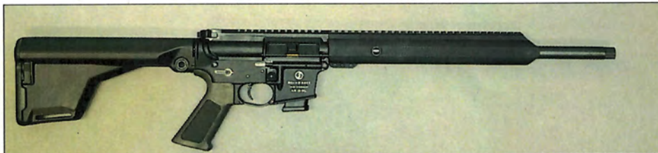
Abbildung 2: „Schmeisser AR 15 Sport 9L“, Ansicht rechte Seite