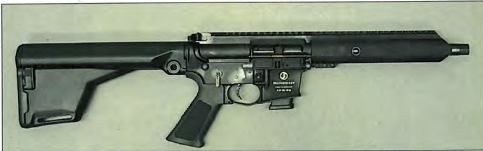
Abbildung 4: „Schmeisser AR 15 Sport 9S“, Ansicht rechte Seite

Beide Waffen sind eigene Neufertigungen. Zum Zeitpunkt der Untersuchung stand keine vollautomatische Referenzwaffe im passenden Kaliber zur Verfügung.