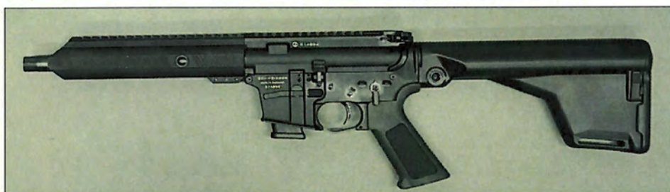
Abbildung 3: „Schmeisser AR 15 Sport 9S“, Ansicht linke Seite